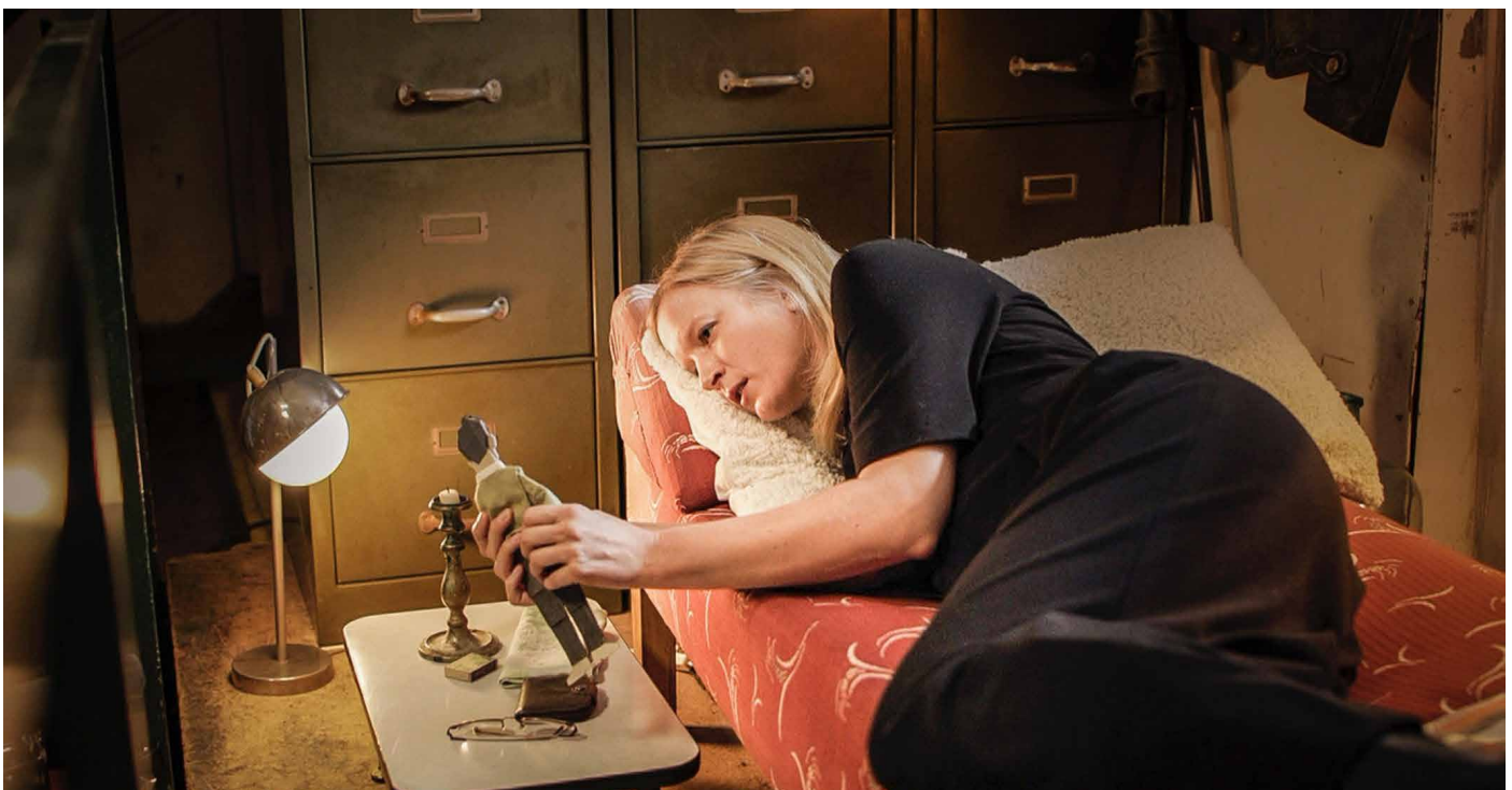
Die Realfilm Szenen wurden in einem Keller in Wien gedreht.