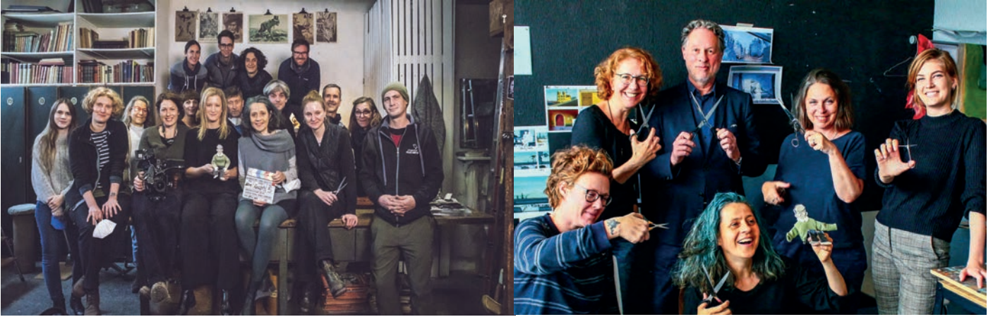
Left: team live action Vienna, right: visit Studio Cou-out-Animation