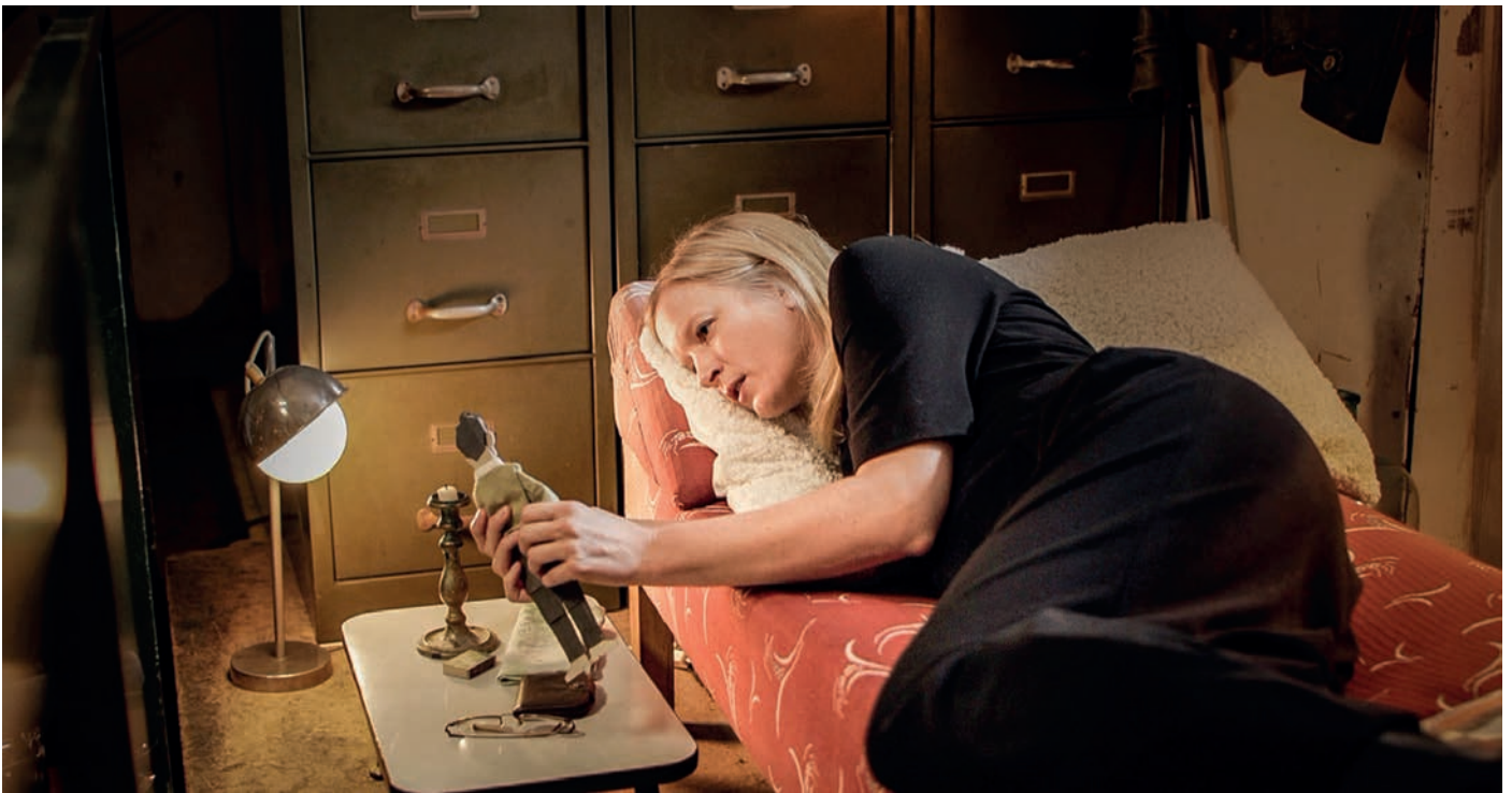
Die Realfilmszenen wurden in einem Wiener Studio gedreht.