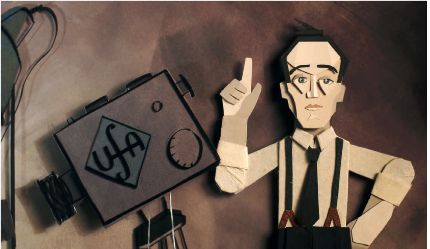
1918 richtete John Heartfield die Trickfilmabteilung der Ufa ein. Alle Flashbackszenen sind in 2,5D Cut-out-Animation mittels Stop Motion in Berlin gedreht worden.